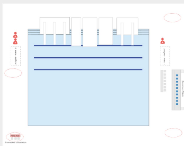
Imagen N° 02: Distribución de Salvavidas durante Competencias

Fuente: Capítulo 14.2.2 Del MEDICAL AND SAFETY SPECIFIC REQUIREMENT FOR DIVING, del Reglamento de World Acuáticos.